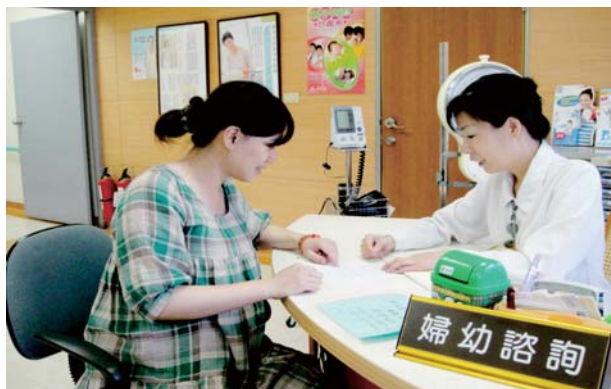
▲產科哺餵母乳衛教與指導諮詢

本市大家長陳菊市長對於婦女友善環境議題非常關注，因而本院在衛生局及婦女友善環境推動顧問的指導下，配合南高雄的區域特性訂定特色目標，並結合遠距醫療照護技術，針對職場婦女推行遠距健康照護方案，落實結合勞工健康資料管理及與婦女癌症篩檢結合，守護職場女性勞工的健康。同時因應三高醫療的需求，特別成立三高門診、成立運動走廊，透過